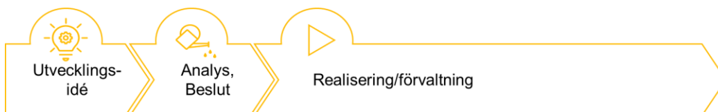
Bild 3 Från idé till realisering

Inera tar emot många utvecklingsförslag från regioner och kommuner. Förslagen bereds, prioriteras och förankrar förslagen utifrån långsiktiga mål och strategier.